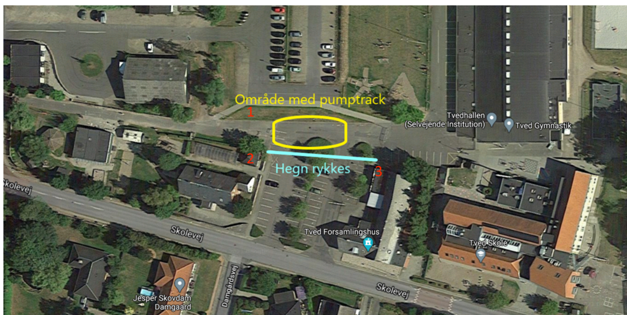
Billede 3 - Pumptrackens placering.

Pumptracken er regnet til at være omkring 300 m 2 og uanset hvad, vil den kunne være indenfor det rykkede hegn og placeret inde fra skråningen med græs 1 , den lille sløjde-hytte 2 og enden af Tved Forsamlingshus 3 , se billede 3.