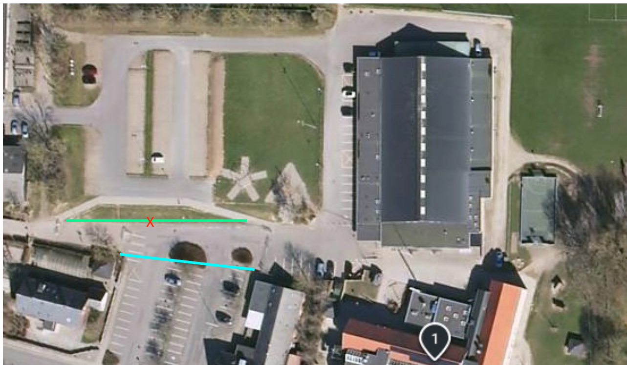
Billede 2 - FØR: Nuværende hegn med grønt, EFTER: Rykket hegn med blåt.

naturlig del af pumptracken og lyse op, når det bliver mørkt, så pumptracken også kan bruges om aftenen - et stort plus!